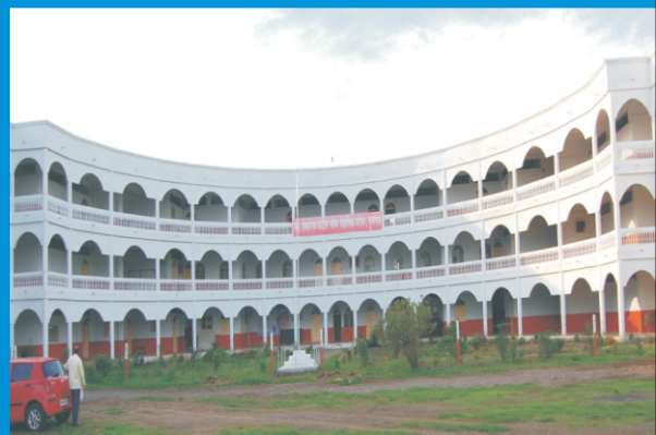
ARTS & SCIENCE COLLEGE, PULGAON