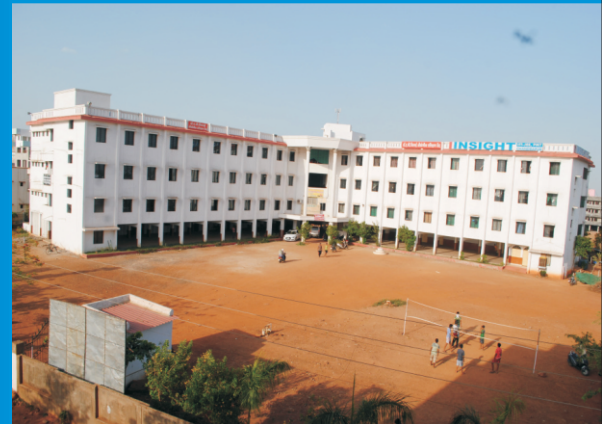
Indira College of Science & Management Chandrapur