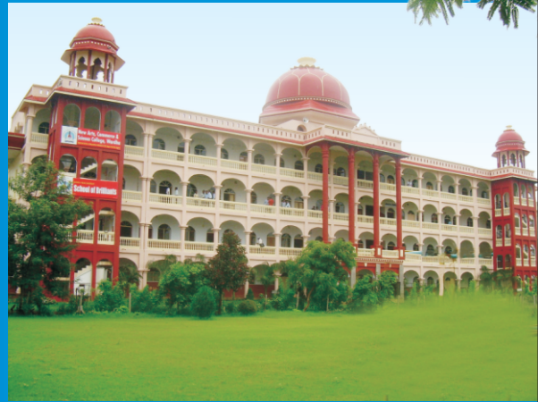
INDRAPRASTHA NEW ART'S, COMMERCE & SCIENCE COLLEGE, WARDHA