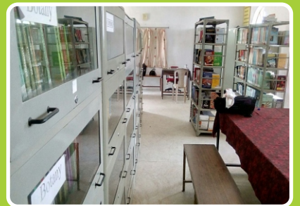
भव्य व प्रशस्त ग्रंथालय विभाग